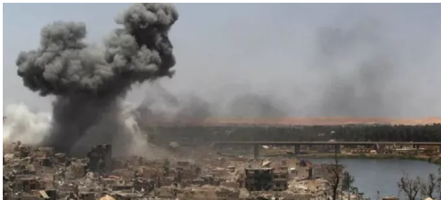
Lladd o hirbell: mae dronau ymosod yn herio dewisiadau moesol y ddynolryw

Mae'r ddwy enghraifft hyn yn dangos bod angen pwyll parthed adroddiadau yn y cyfryngau. Ar yr un pryd, mae hefyd yn amlwg bod e AI, ynghyd â defnydd synwryddion soffistigedig, yn caniatáu i systemau arfau cymhleth fod â lefelau cynyddol o ymreolaeth. Ar hyn o bryd, gall gweithredwr dynol gymeradwyo ymosodiad sy'n defnyddio'r arfau hyn – ond gallai uwchraddio'r system yn dechnegol ddileu'r gofyn am gymeradwyaeth gan fod dynol.