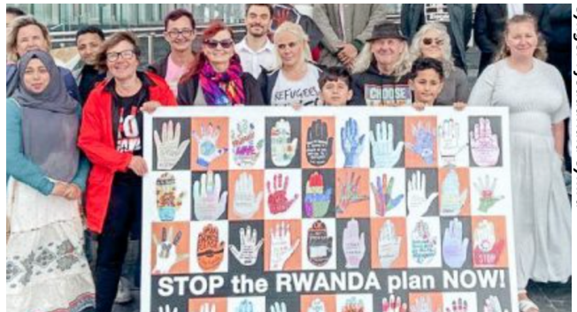
Ym mis Mehefin dyfarnodd y Llys Apêl fod y cynllun Rwanda yn anghyfreithlon

Ceir swyddfeydd Cyngor Ffoaduriaid Cymru yn Abertawe, Caerdydd, Casnewydd a Wrecsam . Mae'r penderfyniad i letya 207 o geiswyr lloches yng Ngwesty Parc y Strade yn Ffwrnes, Llanelli , o'r 3 ydd o Orffennaf, yn hytrach na'u gwasgaru drwy'r gymuned, wedi cynhyrfu barn y cyhoedd. Fodd bynnag, mae grwpiau gwrth-hiliaeth a gwirfoddolwyr cefnogi ffoaduriaid ledled Cymru yn cynnig croeso ac yn helpu i wneud i bobl sy'n aml wedi eu trawmateiddio i deimlo'n gartrefol.