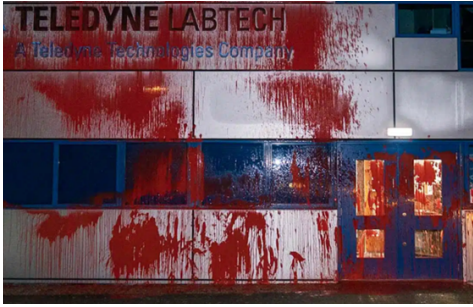
Paent coch: Ffatri yn Llanandras ar ôl y protest