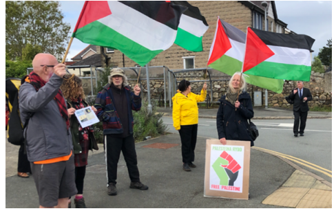
Gwynnos i gefnogi y tu allan Llys y Goron, Caernarfon