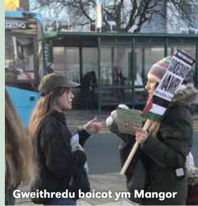
Gweithredu boicot ym Mangor