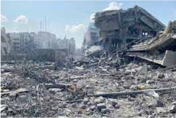
Bomio wedi ei dargedu'n fanwl-gywir?