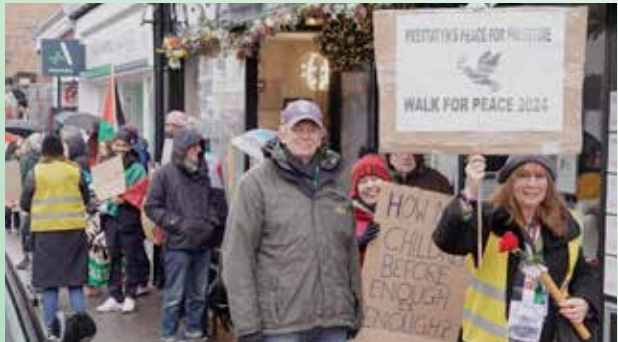
Cerddodd mwy na 150 o bobl trwy Brestatyn ar 2 Mawrth 2024 yn galw am gadoediad ar unwaith yn Gaza.