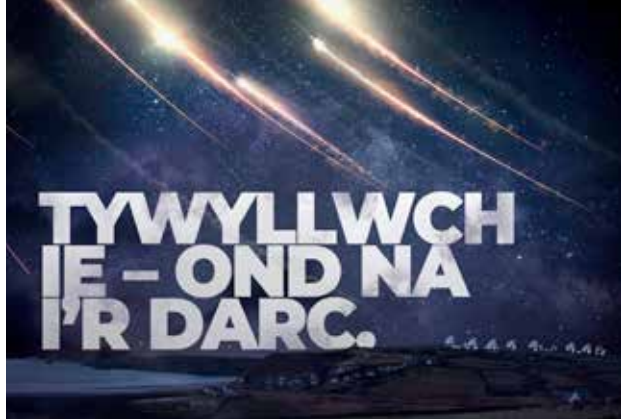
Atal militareiddio'r gofod!

Mae mwy na 60 o sefydliadau a chanolfannau gan y