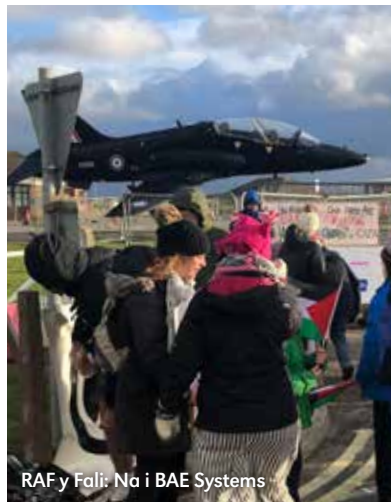
RAF y Fali: Na i BAE Systems

Rhaid condemnio anghyfiawnder pan welwn ni hynny os am gadw ein cwmpawd moesol. Nid yw gwleidyddion sy'n beio protestwyr yn hytrach na throseddwy'r rhyfel yn haeddu ein cefnogaeth. Rhaid i'r gorllewin roi'r gorau i arfogi Israel a sicrhau heddych gwirioneddol, cyfiawn a pharhaol i holl bobloedd y rhanbarth: dim mwy o adleisio ystrydebau heb wneud dim byd. Nid diwedd yw cadoediad, ond cam cyntaf.