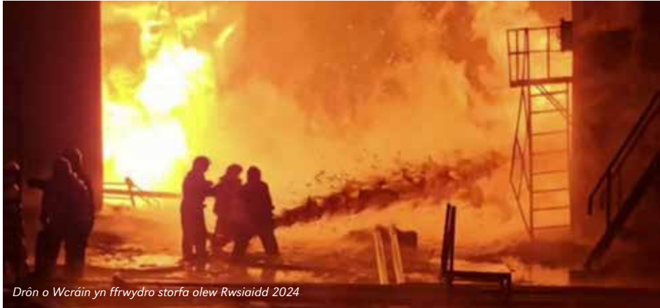
Drôn o Wcráin yn ffrwydro storfa olew Rwsiaidd 2024

Mae'n syndod mor brin yw'r ymchwil a'r wybodaeth sydd ar gael i'r cyhoedd am y cysylltiad rhwng newid yn yr hinsawdd a militariaeth, ond mae effaith rhyfel a'r diwydiant arfau ar yr hinsawdd i'w weld ar sawl lefel, o'r deunydd crai a'r egni sydd ei angen i gynhyrchu arfau, i'r llygredd a'r CO 2 a gynhyrchir gan hyfforddi milwrol a rhyfeloedd. Rhaid ystyried hefyd y difrod y gall rhyfel ei achosi i'r amgylchedd, a sut y gall newid yn yr hinsawdd ei hun arwain at wrthdaro a rhyfel.