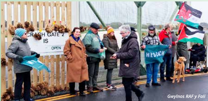
Gwynlos RAF y Fali

Ar fore'r 23 Chwefror cynhaliwyd gwynlos wrth y ffens amgylchynol i gefnogi'r Diwrnod Gweithredu Byd-eang i Gau Safleoedd Milwrol.