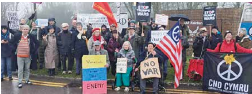
Herio tywydd gaeafol yn RAF (USAF) Fairford, Swydd Gaerloyw, 18 Ionawr 2026, mewn protest yn erbyn atafaeliad anghyfreithlon yr UD o danceri olew ger arfordir Venezuela.

Nid yw UDA yn gynghreiriad dibynadwy. Mae'r 'bys ar y botwm niwclear' yn perthyn i Arlywydd sy'n anwadal ac yn anghyson, ac nad yw'n parchu cyfraith ryngwladol.