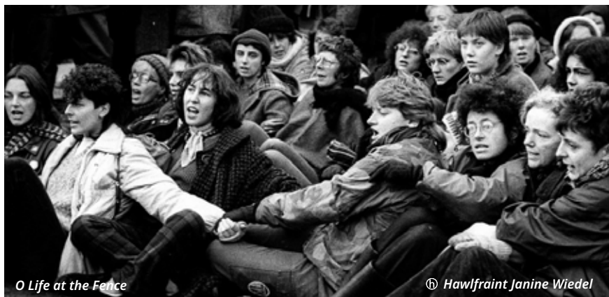
O Life at the Fence