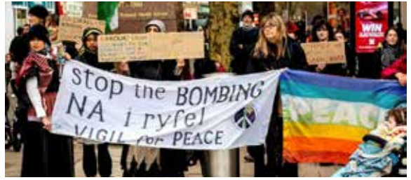
Gwynnos Caerdydd, Gŵyl Dewi 2026. Rhyfel anghyfreithlon arall heb fandad yn rhwygo drwy'r Dwyrain Canol. Starmer yn penderfynu y man i adael i'r UD hedfan o feysydd awyr 'RAF'. Dim ond yr Iraniaid ddylai benderfynu ar eu dyfodol, nid Trump a Netanyahu. STWC Caerdydd

Mae'r CU a'i asiantaethau'n cael eu hamddifadu o gyllid gan UDA a gwledydd eraill. Mae dadgyllido yn ergyd farwol i'n holl obeithion am blaned well. Heb gyllid digonol, mae'r CU yn analluog. Mae Israel, sy'n anwybyddu penderfyniadau'r CU yn gyson, ac UDA yn ymosod