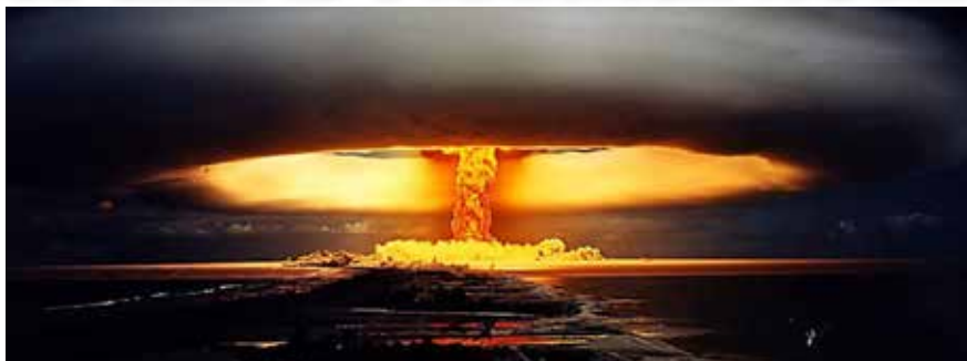
O ddfri? Yn ôl at hyn? Profion niwclear ym Mholynesia Ffrengig ym 1971