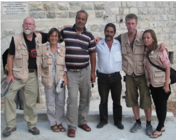
Tîm 43 EAPPI yn Yanoun, mis Medi 2012