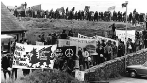
Fel yr oeddem: y 23 o Chwefror 2026 oedd 44 mlwyddiant arwyddo Cytundeb y Gymru Ddi-niwclear