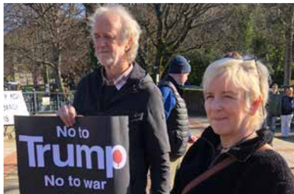
Bangor, Dwylo oddi ar Iran 7 Mawrth '26

Yn y cyfnod byr ers y Nadolig diwethaf, ysgubodd corwynt o drais gwladol anghyfreithlon y byd. Caiff penaethiaid gwledydd tramor eu herwgipio neu eu llofruddio ar gais un dyn. Cyhoeddir rhyfeloedd heb unrhyw fandad democrataidd. Caiff adnoddau gwledydd eraill eu lladrata a'u cludo