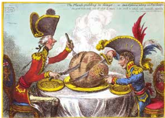
James Gilray, 1805

Cerfio'r cwbl i fyny, y tacle trachwantus... a dal i wisgo hetie dwl heddiw! Mae imperialaeth yn ôl mewn ffasiwn. O.N. A ddiflannodd e go iawn erioed?