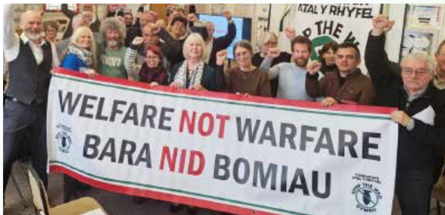
Neges amserol o gynhadledd Atal y Rhyfel yn yr Wyddgrug, a oedd yn digwydd wrth i Israel-UDA ailgychwyn eu rhyfel anghyfreithlon gydag Iran. STWC Cymru