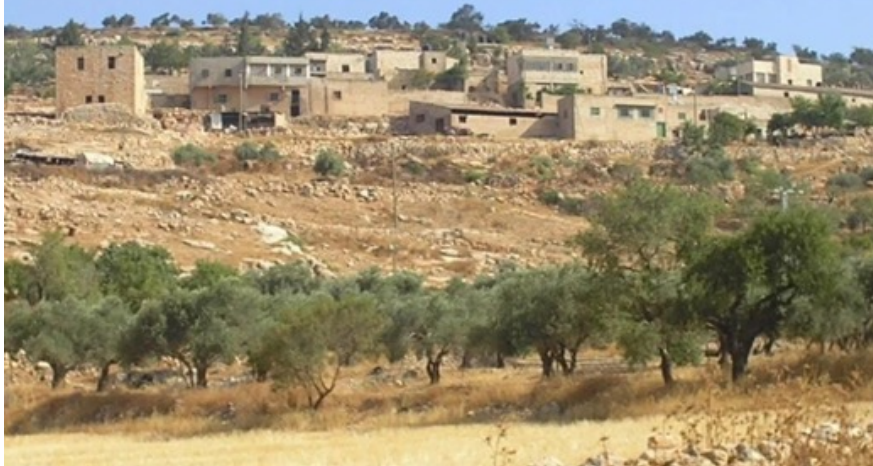
Yanoun a'i goed olewydd